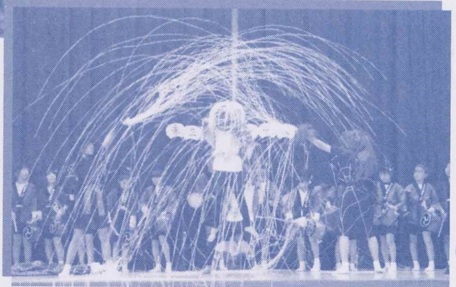
〈第11回こども六斎教室成果発表会から〉