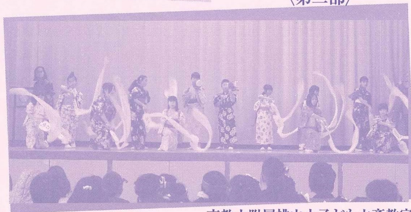
京教大附属桃山小こども六斎教室