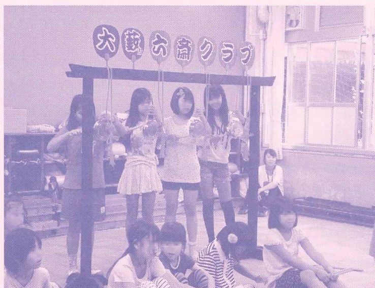
大藪小学校六斎クラブ